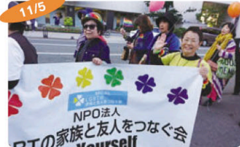
11/5 九州レインボー・プライド