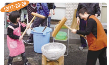
12/17-23/24 年末は、各町内での餅つきに参加