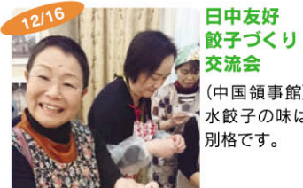
12/16 日中友好餃子づくり交流会 (中国領事館) 水餃子の味は別格です。