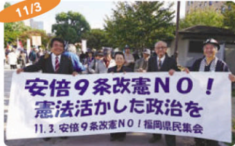
11/3 憲法フェスタin福岡