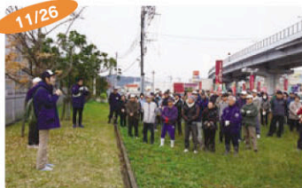
11/26 室見川河岸清掃(橋本車両基地) 室見川周辺自治会と一斉にゴミ拾い。

Jアラート訓練中止の申し入れ 情報伝達訓練としながら特定の国を名指して「弾道ミサイルの飛来に対応する」として、12月1日にJアラートによる訓練を実施しました。この訓練は、特定の国への敵意と差別を生み出し、市民に無用な不安と危機感をおよぼす懸念が拭えないことから中止の申し入れを行いました。