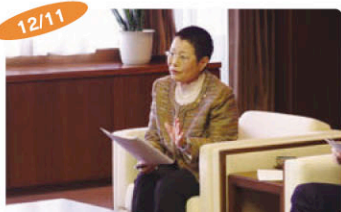
12/11 福岡市民クラブ、2018年度予算要望