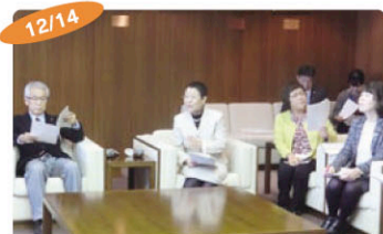
12/14 西区議員団、市長へ30項目の西区事業要望 西部市場の跡地利用や室見川乙井出堰により分断された園路整備の着手などが実現しました。