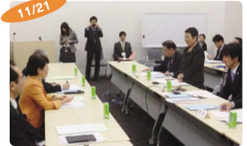
11/21 国会への党派別予算要望