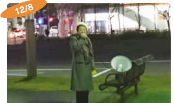
12/8 「12.8 不戦の誓い」街頭行動 「太平洋戦争開戦の日」に、戦争へつながる「戦争法」・「共謀罪」法の廃止を訴えました。