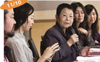
11/10 学校給食意見交換会