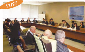
11/27 障がい者当事者団体の要請行動 障がい者福祉の充実を求める当事者団体の要請行動に同席。